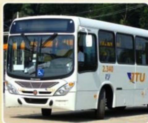
Transporte urbano já está circulando pelas ruas do bairro

O Villa Branca conta com mais uma comodidade para seus moradores e visitantes. Em outubro, passou a circular, pelas ruas do bairro, a Linha 11 (Rio Comprido – Balneário Paraíba). O ônibus circula pela Rua das Notas e Avenida das Letras e segue em direção ao centro, passando pelas principais avenidas da cidade, o que facilita e beneficia a vida de trabalhadores e estudantes.