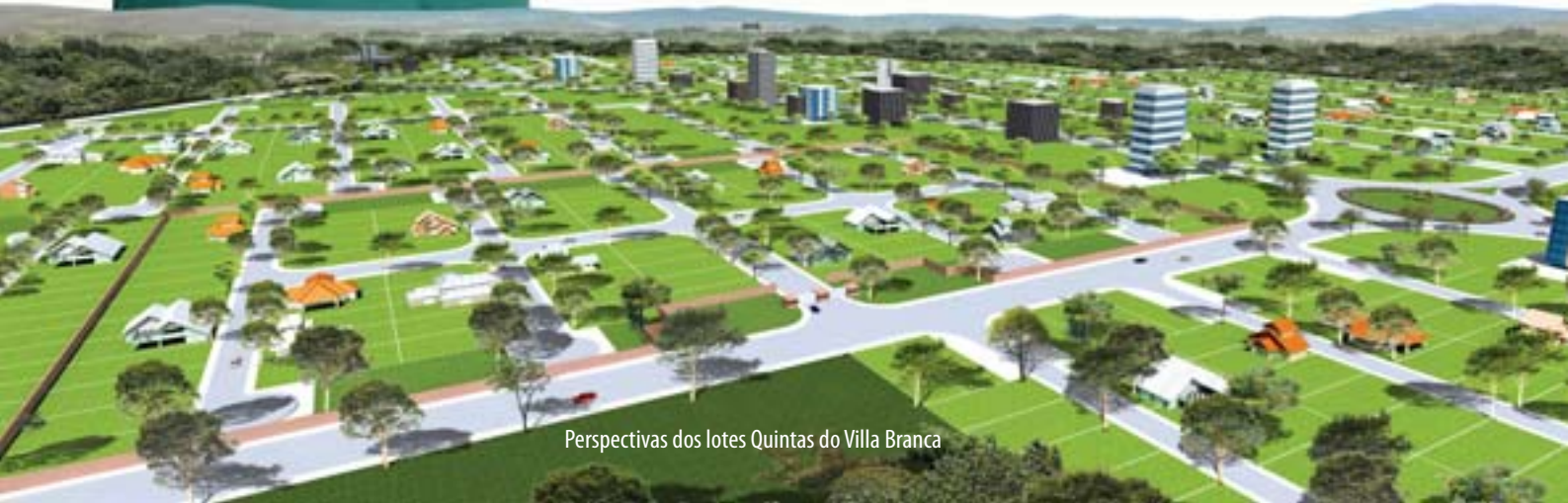
Perspectivas dos lotes Quintas do Villa Branca

Consulte outros planos com o corretor no local (* ) Financiado em 120 parcelas. Valor total a vista R$ 66.000