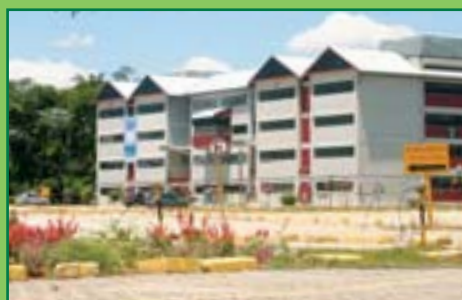
UNIVAP e UNIP