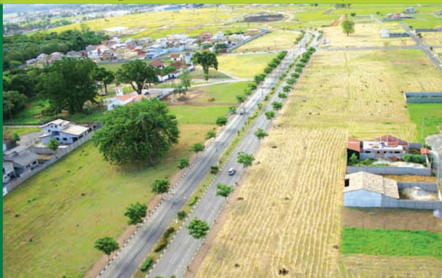
Foto aérea da avenida principal do Villa Branca