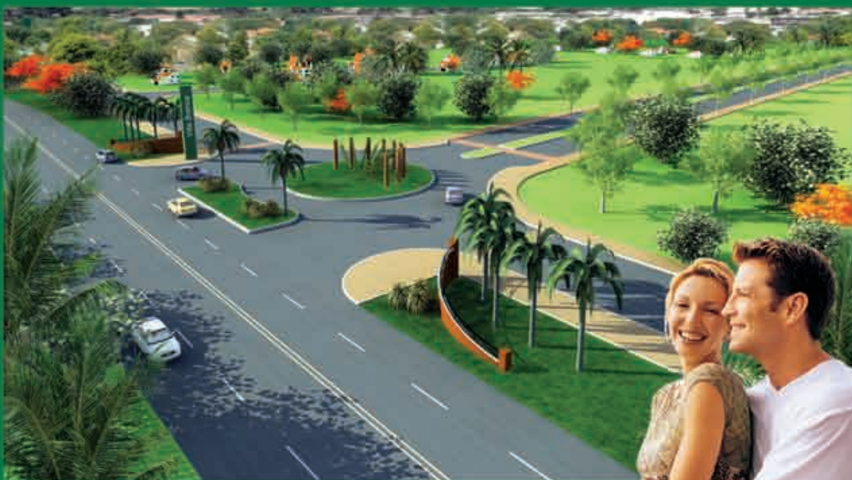
Perspectiva do Portal Ornamental