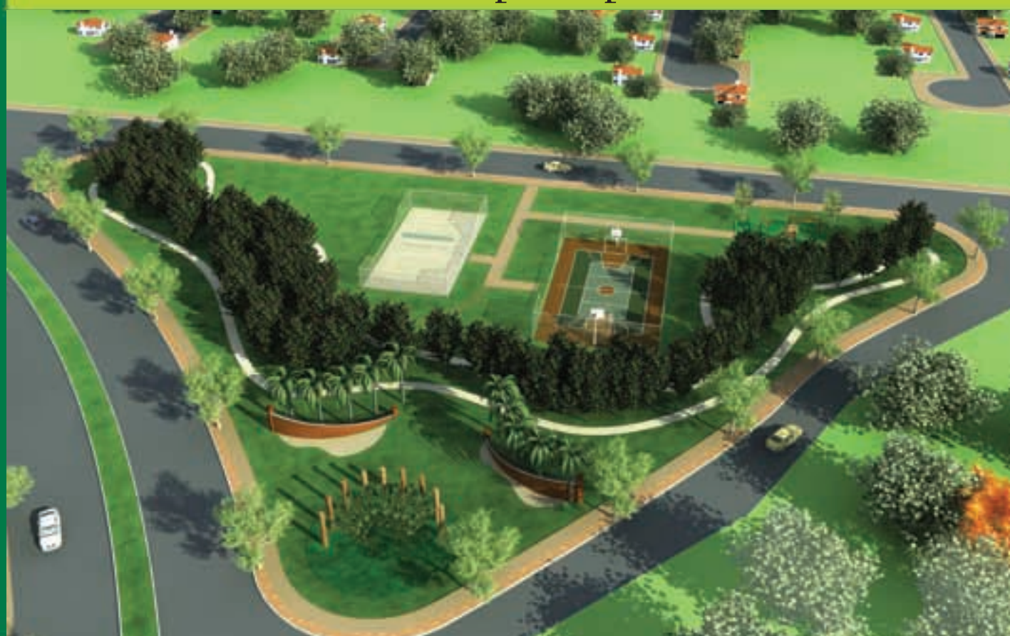
Perspectiva da área de lazer