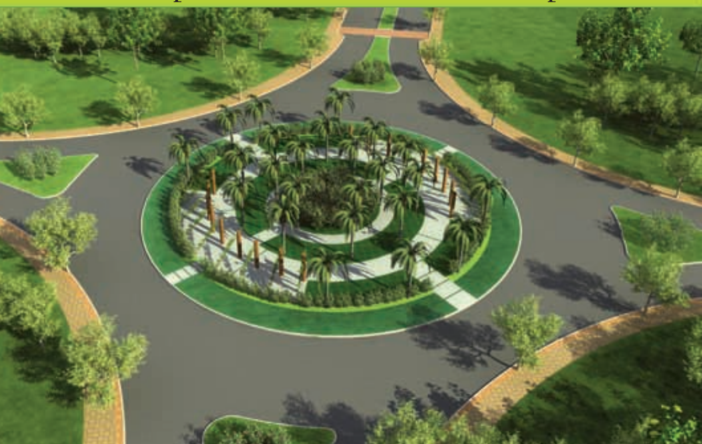
Perspectiva da praça contemplativa