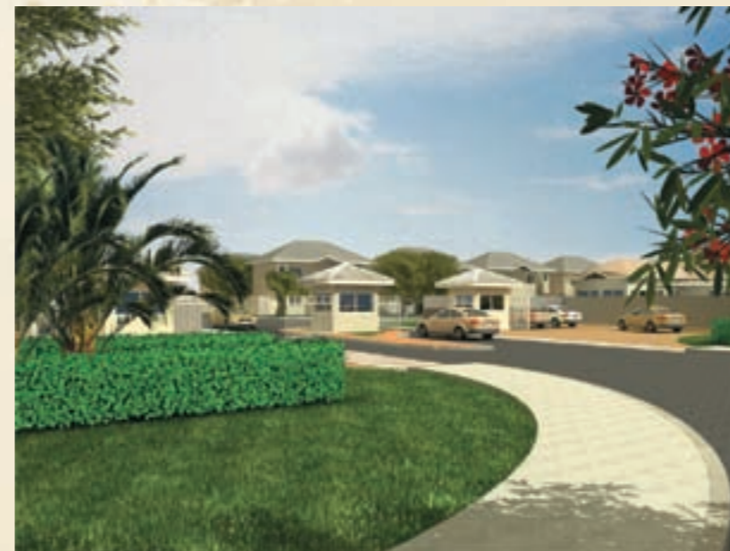
PERSPECTIVA ARTÍSTICA DA PORTARIA