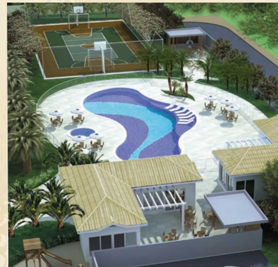
PERSPECTIVA ARTÍSTICA DO CLUBE