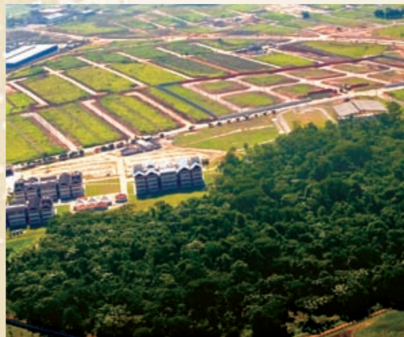
VISTA AÉREA DA RESERVA DE MATA ATLÂNTICA E UNIVAP VILLA BRANCA

No Villa Branca, você vai viver em contato com a natureza, sem abrir mão de uma completa infra-estrutura de comércio e serviços, com shoppings, hipermercados, escolas e duas universidades.