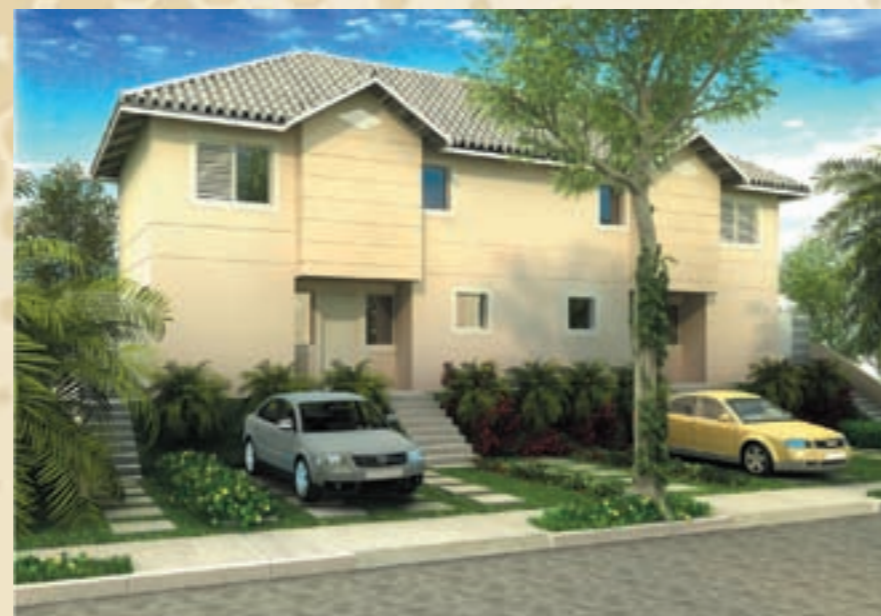
PERSPECTIVA ARTÍSTICA DA CASA DE 3 DORMITÓRIOS (1 SUÍTE) 105,98M²